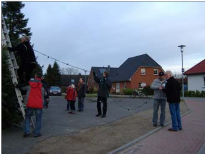
Viele Hände packten kräftig zu...