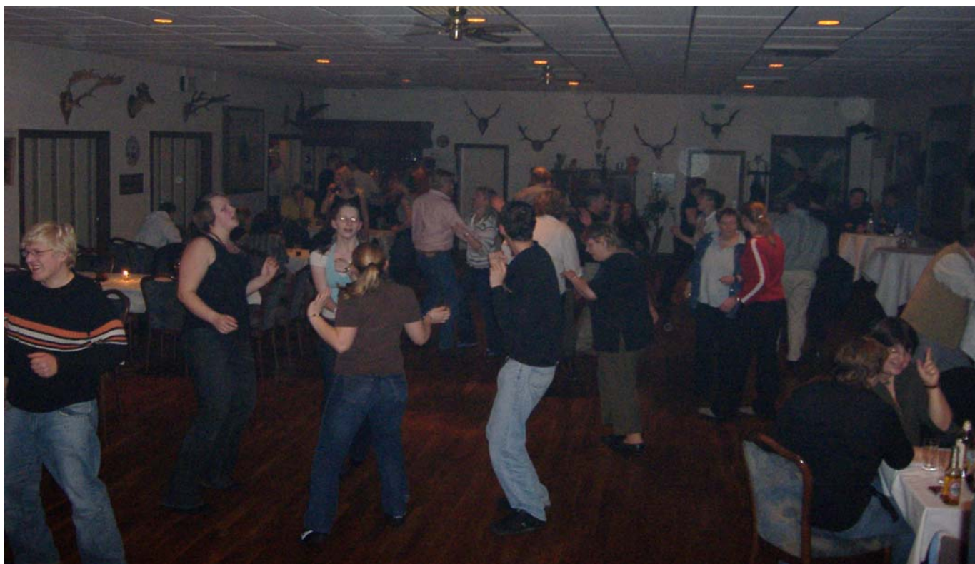
Nach dem „offiziellen“ Teil feierten die Lajus noch ausgiebig auf ihrer Party in Dibberns Gasthof.

Die „Lajus“ treffen sich einmal in der Woche für gemeinsame Unternehmungen und haben immer viel Spaß, z. B. beim Bowlen, Kino, Spieleabend, Essen und mehr.