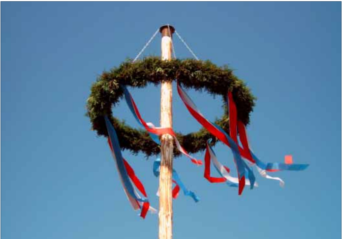
Strahlender Himmel und wehende blau-weiß-rote Fahnen an Osdorfs 1. Maibaum.